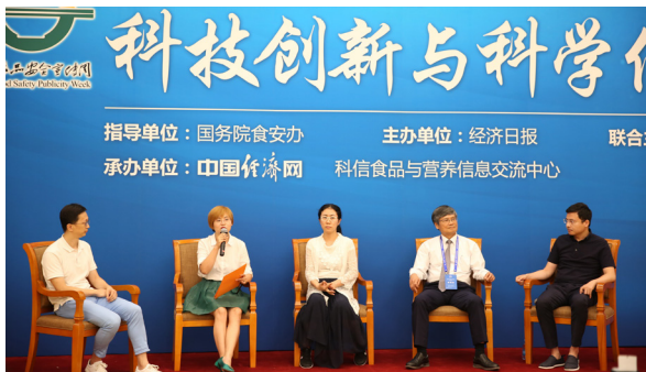
对话环节：新时代如何做好食品安全科普

食品科学检测技术学科专家庞国芳院士 测技术信息化，实现弯道超车，以达到国际领先水平。另一方面加大对食品安全农药残留污染的治理力度，重拳治理剧毒和禁用农药；加强研制农药残留限量标准和每日允许摄入量标准，而且要和世界先进国家对标；创立国家级农药残留监控研究实验室和国家农药残留基础大数据库，加强农药毒理学基础研究；把各类产品农药残留报告纳入到各级政府的购买计划中。