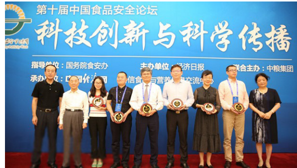
颁发食品安全创新技术奖

“新时代如何做好食品安全科普”两个方面进行了主题演讲和对话。对于如何在食品领域更好的创新，如何打击谣言还原科学真相，如何树立企业责任感，提高消费者获得感进行了深入讨论。