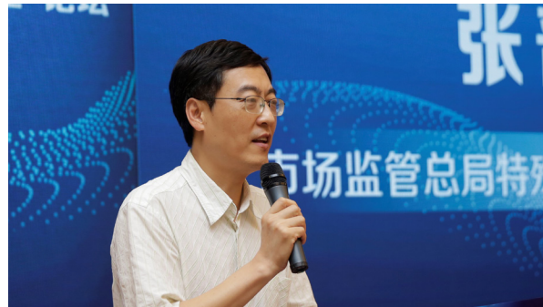
国家市场监督管理总局特殊食品注册司 张晋京稽查专员

高互联网食品安全抽检频次；建立与网络第三方平台进行约谈机制，严厉查处违法违规的经营行为。