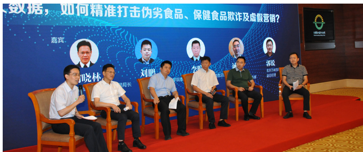
对话环节：如何精准打击伪劣食品、保健食品欺诈及虚假营销