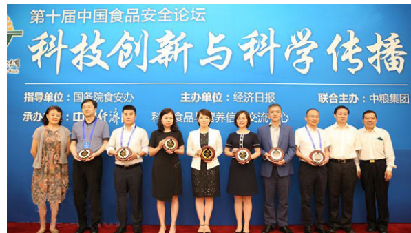
颁发食品安全示范项目奖

论坛现场还举行了“2017-2018 食品安全创新技术、示范项目”发布和颁奖仪式。由科信中心理事长陈君石院士领衔的专家组经过初评、审议、公示等环节，上海海洋大学的“海产品质量安全评估与控制技术”、雀巢食品安全研究院的“食品中矿物油检测确证技术”等在内的6项科研成果被评为食品安全创新技术；光明乳业股份有限公司的“奶牛养殖与原奶质量全程追溯管控平台”项目、北京便利蜂连锁商业有限公司的“便利店食品安全的自动化管控”项目等在内的7项科研成果被评为示范项目。科信中心理事长陈君石院士等评审专家分别为获奖单位代表颁发奖牌。