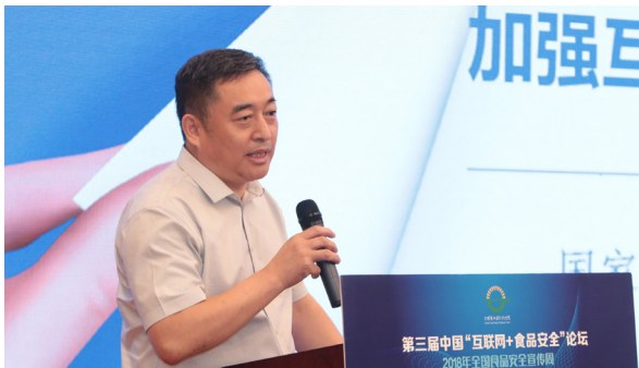
国家市场监督管理总局食监二司马纯良司长

随后，国务院食安办副主任、国家市场监督管理总局孙梅君副局长在致辞中表示：互联网+食品安全的治理需要我们各界共同努力。一是平台和经营者要履行主体责任，互联网+食品安全的关键在网络平台，必须树立尚德守法的经营理念，特别是网络订餐平台，要落实入网者的审查责任；二是监管部门需要从过去单纯管主体、管行为、管产品，转变为更多的管信息、管信用，集成生产经营销售、许可准入、监管执法、消费者投诉、信用记录等多方面的信息，完善企业信息数据库，充分利用大数据、云计算分析识别风险，提高监管的针对性、法效性和有效性；三是行业协会要充分发挥掌握的行业信息、专业技术优势，引导和督促食品经营者依法生产经营，新闻媒体要积极开展食品安全法律法规，食品安全知识的公益宣传，针对网络食品安全方面的热点、难点、焦点问题客观回应社会关切，引导社会客观理性面对食品安全的问题。