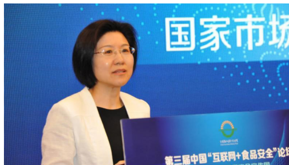
国务院食安办副主任、国家市场监督管理总局 孙梅君副局长