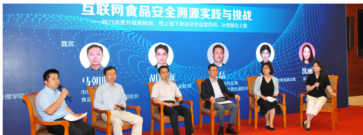
对话环节：互联网食品安全溯源实践与挑战

会后，大家一致认为：此次由科信中心主办的“第三届中国互联网+食品安全论坛”为业界搭建沟通交流的平台，为保障食品安全建言献策，充分发挥作为第三方食品信息交流机构作用。希望通过多方不懈的努力，不断增强消费者对食品安全的获得感、幸福感和安全感！