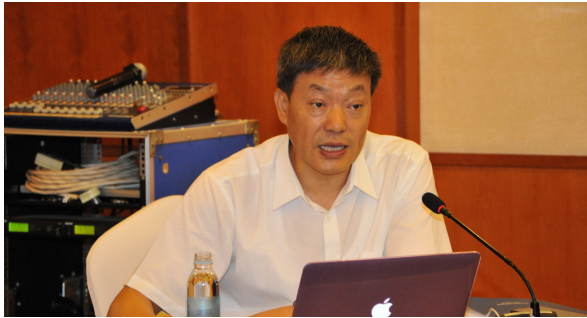
海关总署进出口食品安全局 毕克新局长

出，习近平总书记关于食品安全的重要论述是进出口食品安全监管工作的根本遵循。他强调，进出口食品安全链条长、要素多、标准高、超敏感，监管难度大，需要从落实责任、防范风险、服务发展、完善体系四个方面落实监管理念和要求。进出口食品安全最新的改革方向是将责任与利益紧密相连，加强相互监督，提供通关便利，使进出口食品越来越安全，食品贸易越来越顺畅。